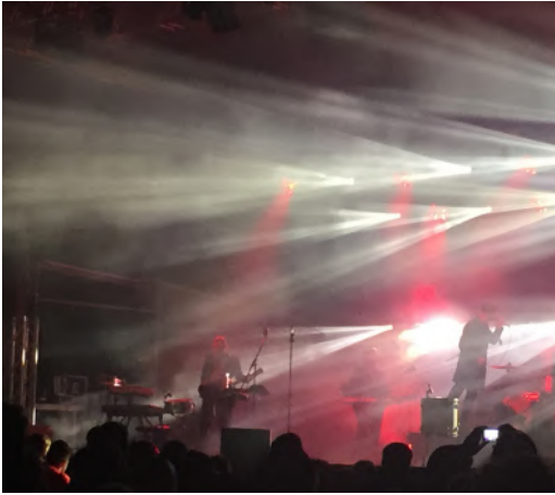
▲ Kultura masowa może być interesująca i ambitna. Na zdjęciu: koncert zespołu Fisz Emade Tworzywo.

moda i rynek. Naczelne miejsce zajmują w nim idole lansowani przez wysokonakładowe pisma, stacje telewizyjne i wytwórnice płytowe. Gwiazdy popkultury są na tym rynku takim samym produkt em jak wytwory ich pracy; kampanie reklamowe, które niewiele różnią się od działań mających wypromować nowe rodzaje batoników czy chipsów, pochłaniają ogromne sumy i znacząco podnoszą cenę samej płyty czy filmu. Rynek „ przemysłu kulturalnego ” dawno już przekroczył granice państw i kontynentów, można więc mówić o jego globalnym charakterze. Wbrew obiegowym opiniom globalizacja kultury masowej nie jest bynajmniej równoznaczna z jej amerykanizacją, lecz raczej z uniwersa-