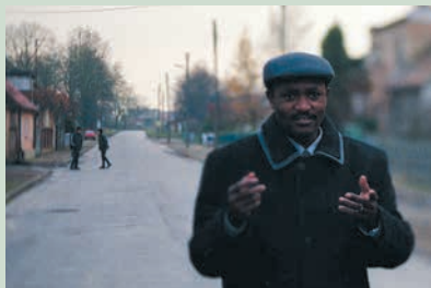
▲ Killion Muniyama (czytaj: kilion mun-jama) był pierwszym w historii czarnoskórym radnym powiatu grodziskiego, a potem województwa wielkopolskiego. Od 2011 roku sprawuje mandat poselski.

Skąd biorą się fundusze na kampanię wyborczą? Jest ona zwykle finansowana ze składek członkowskich partii wystawiających swoich kandydatów oraz z pieniędzy ofiarowanych przez darczyńców, którzy dokonują imiennych wpłat na cele kampanii.