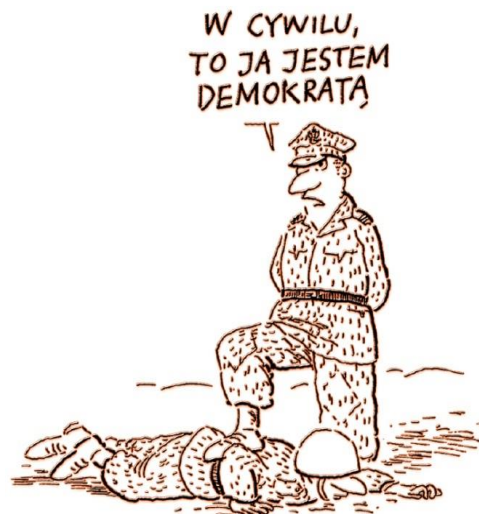
Rys. Julian Bohdanowicz

Demokracja to ustrój, w którym władza należy do ludu, pojmowanego jako ogół obywateli (zasada suwerenności ludu). Tak więc każdy obywatel jest w demokracji zarówno tym, który może sprawować władzę i wydawać polecenia, jak i tym, który jest władzy podporządkowany i musi te polecenia wypełniać. W demokratycznej praktyce to, jaka jest wola ludu, sprawdzane jest w głosowaniu – uważa się, że jest ona zgodna z decyzją większości. Dlatego właśnie niekiedy mówi się, że demokracja to rządy większości.