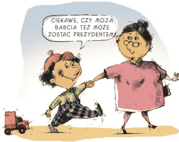
Rys. Piotr Rychel