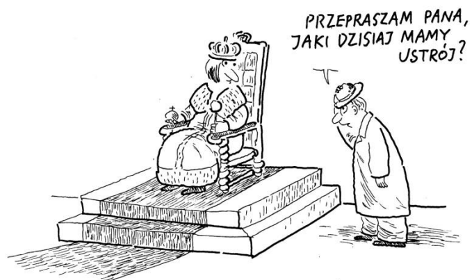
Rys. Julian Bohdanowicz

Republika to z kolei system, gdzie głowa państwa (prezydent) wybierana jest przez obywateli albo ich przedstawicieli na ściśle określony czas. Używając pojęcia „republika”, trzeba jednak pamiętać, że słowo to (którego notabene polskim odpowiednikiem jest „ rzeczpospolita ”) czasem używane jest w innym znaczeniu – państwa, które obywatele uważają za swoje wspólne dobro i ożywieni „duchem republikańskim” są gotowi do działań na jego rzecz.